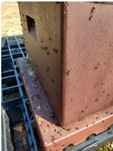
Stackmyran Formica rufa kan under våren angripa bikupor i jakt på föda.

Stackmyror kan vara ett stort problem för bisamhället på våren. De kan snabbt plundra samhället på både foder och larver. En stor myrstack kan på några få dagar ödelägga en hel bigård. Att förebygga angrepp av myror är därför viktigt. Dubbla lager plast kan läggas på pallen som kupan står på eller kan kupans ben ställas i burkar med olja eller annan vätska som förhindrar myrornas passage. Myrorna är dock mycket motiverade att nå bisamhället då kupans näringsrika innehåll är åtråvärd för deras uppbyggnad av stacken.